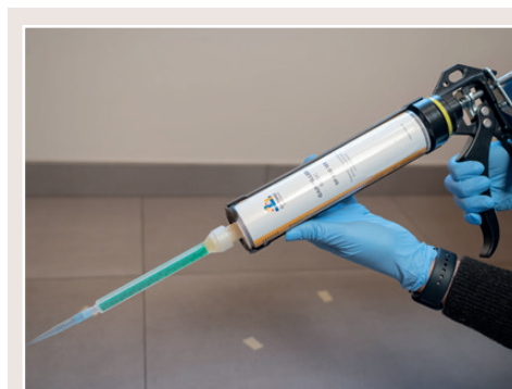
System Gap Filler Basic z dwukomponentowym preparatem do wypełniania pustek

Dzięki płynnej formie , preparat Gap Filler skutecznie penetruje wszystkie pustki i szczeliny, zapewniając trwałe i solidne wypełnienie. Nie rozpręża się , a tym samym eliminuje ryzyko pęknięcia czy odspojenia płytki od podłoża podczas wiązania. Dwuskładnikowa masa jest