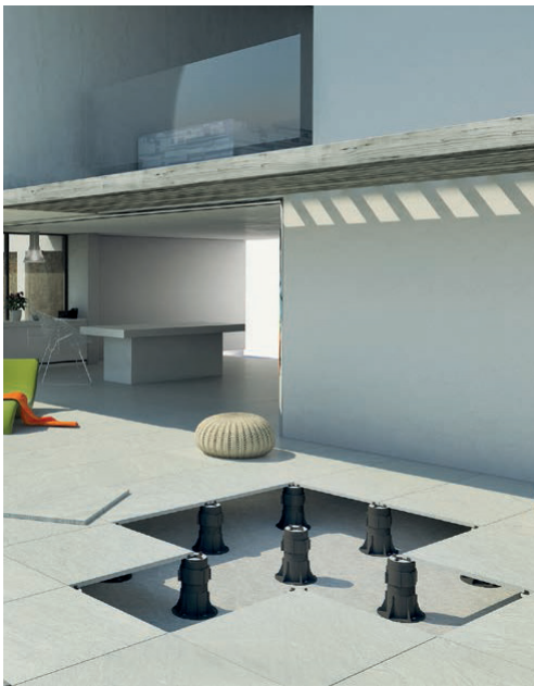
Fot. 2. Przykład ułożenia płyt na tarasie z użyciem podpór regulowanych PRIME ETERNO IVICA

stwierdzenie, że płytki się NIGDY NIE ODKLEJĄ, trafiło do opornych ☺