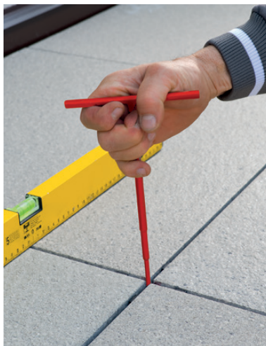
Fot. 5. Zastosowanie klucza do regulacji wysokości podpór

Zakres wysokości podpór ETERNO IVICA jest bardzo duży i wynosi 6–40 mm w przypadku ich wersji nieregulowanej oraz 10–945 mm (prawie metr!) – regulowanej.