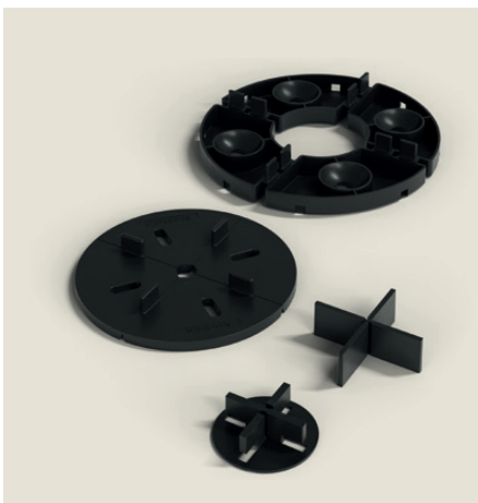
Fot. 3. Podpory nieregulowane ETERNO IVICA