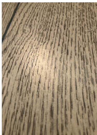
Tusz ceramiczny nadający powierzchni właściwości hydrofobowe