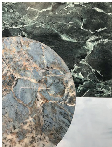
Do zdobienia płytki wykorzystano kombinację szklivi aplikowanych na mokro oraz na sucho

EB: Aby zapewnić dobrą przyczepność szkliwa do powierzchni płytek, Colorobbia opracowała i wprowadza na rynek rodzinę klejów do aplikacji cyfrowej na bazie rozpuszczalników i wody. Jak wspomniałem, światowy rynek szklivi do cyfrowego nanoszenia na płytki ceramiczne będzie się zwiększał. Połączenie cyfrowego kleju oraz nakładania szklivi na sucho jest najlepszym rozwiązaniem, szczególnie w przypadku produktów z najwyższej półki. Colorobbia współpracuje z czołowymi producentami urządzeń do druku i szklwienia cyfrowego. Obecny poziom digitalizacji linii produkcyjnej pozwala na nakładanie szklivi na sucho