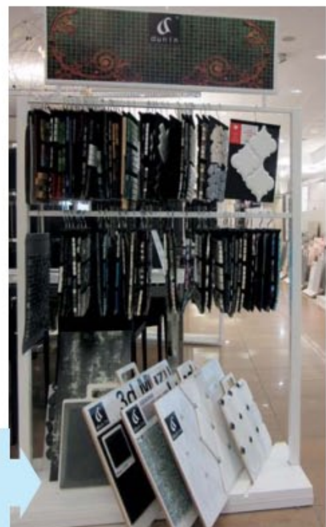
Kolekcja ARABESCO firmy DUNIN Sp. z o.o. – Perła Ceramiki UE 2016