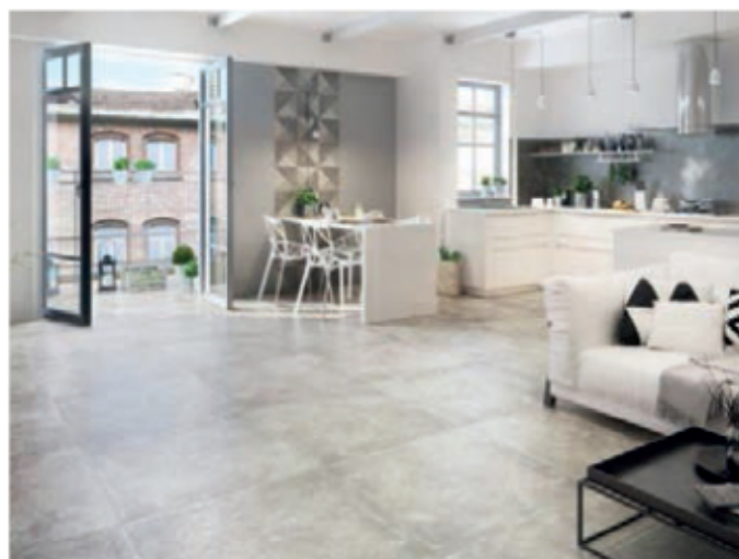
Kolekcja gresu szklionego TRAKT

W tegorocznym konkursie Red Dot Design Award wśród wyróżnionych nagrodą uznawaną za „Oscara designu” znalazła się Ceramika Paradyż, którą nagrodzono w kategorii Product Design 2016 za kolekcję wielkoformatowego gresu szklionego TRAKT. Jest to jedna z propozycji Ceramiki Paradyż w najnowszym formacie 75 x 75 cm. Odzwierciedlająca naturę kolekcja dostępna jest w pięciu uzupełniających się kolorach, tworzących paletę barw ziemi. Wzór na płytkach naniesiono przy użyciu technologii cyfrowej, a ich powierzchnię pokry-