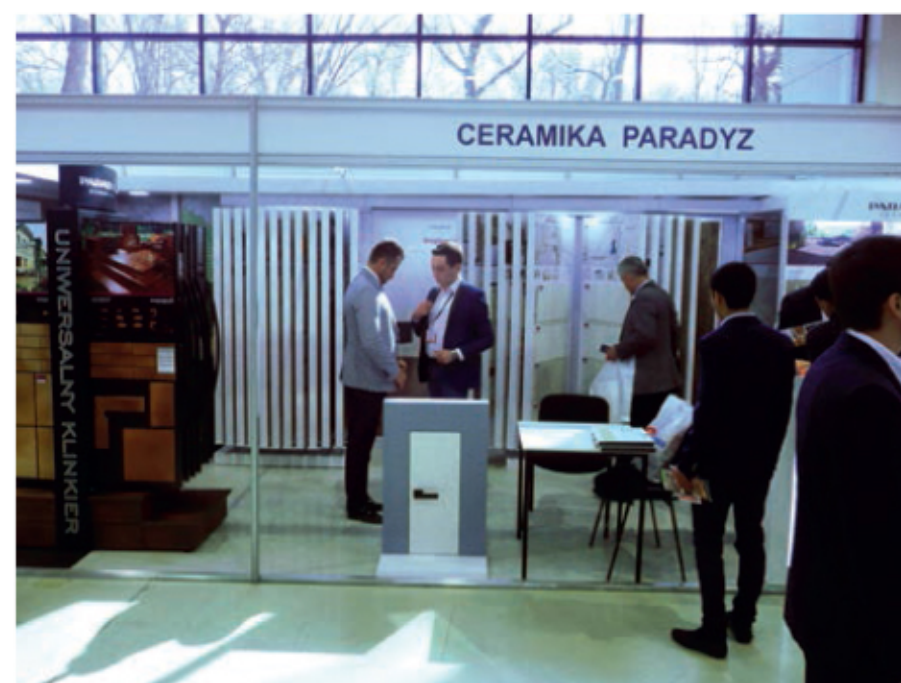
Stoisko Ceramiki Paradyż na targach UzBuild 2016

Targi UzBuild odbyły 2–4 marca 2016 r. w Taszkencie. Ponad 13 274 odwiedzających, 186 wystawców z 22 krajów – to liczby, które najlepiej obrazują fakt, że są one jedną z największych imprez wystawienniczych, rozpoczynającą sezon budowlany w Uzbekistanie.