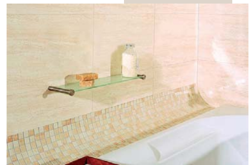
Fot. 4. Kasandra