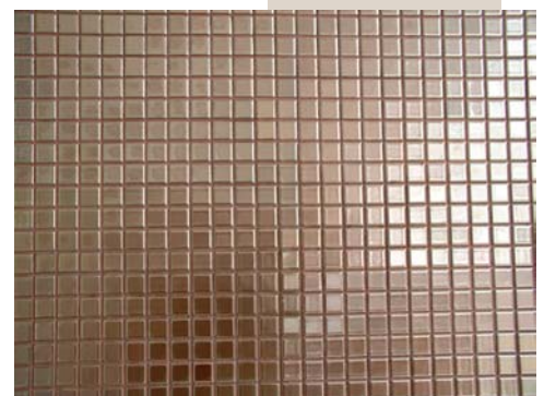
Fot. 5. Nitt