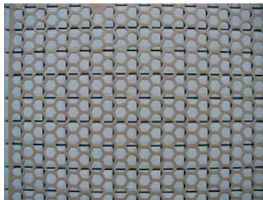
Fot. 1. Mozaika podklejana na siatce papierowej

Mozaika prasowana jest dostępna w dwóch wariantach podklejania, tzn. na siatce papierowej (fotografia 1) oraz na punktach plastycznych (fotografia 2), natomiast mozaika cięta w wersji z siatką papierową. Wymiary nominalne podklejonych paneli wynoszą 30x30 cm.