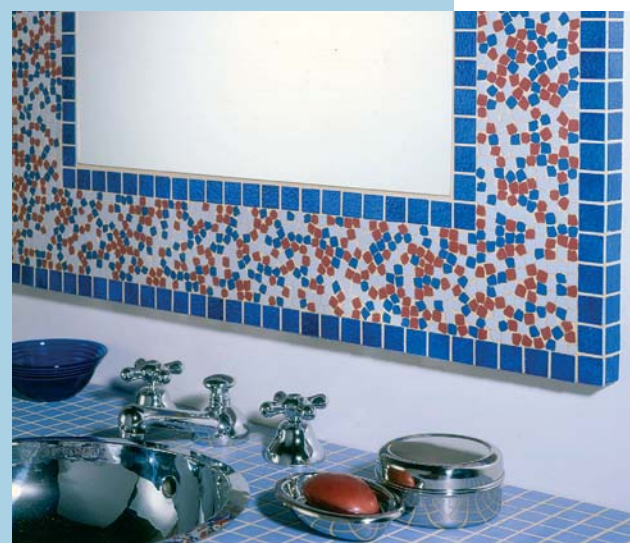
Fot. 6. Emaux de Briare – seria Impromptus