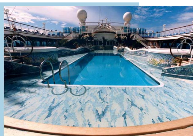
Fot. 5. Emaux de Briare – statek Disney Cruise