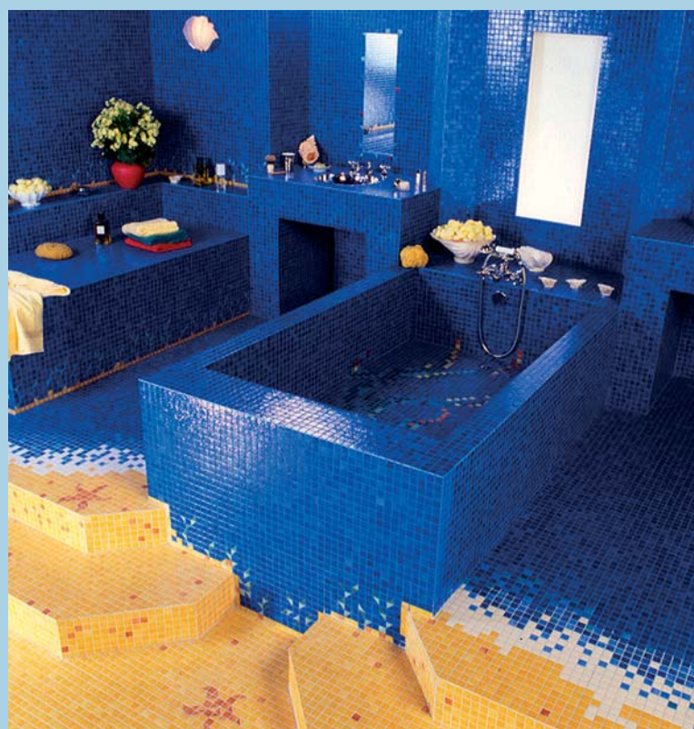
Fot. 4. Emaux de Briare – seria Harmonies zastosowana w SPA

Producent założył w Briare Muzeum Mozaiki gdzie można podziwiać sztukę zdobienia od starożytności po czasy współczesne. Więcej na www.briare.pl