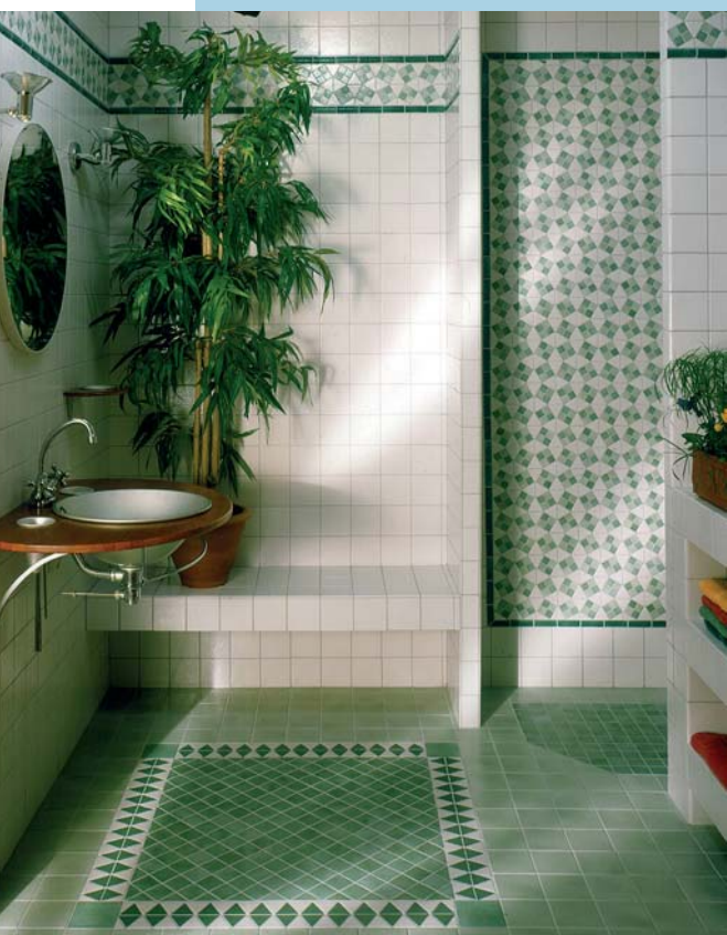
Fot. 1. Emaux de Briare – seria Trio et Gaudi