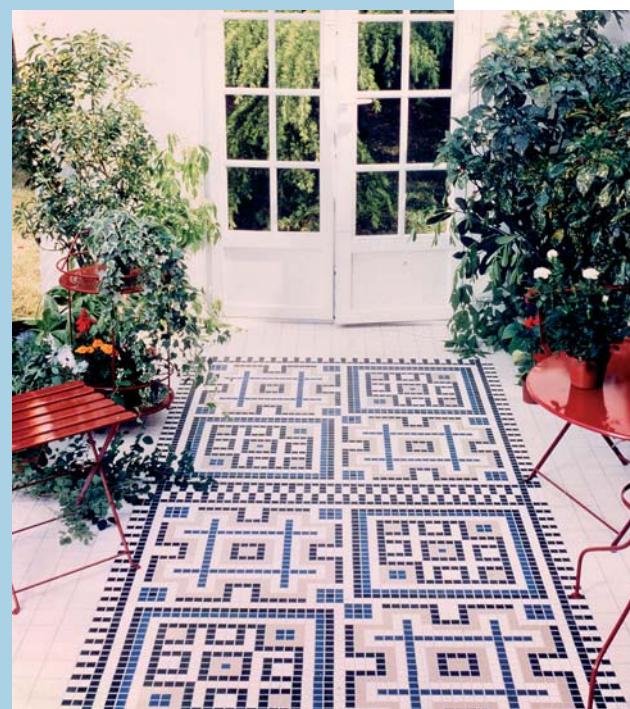
Fot. 7. Dywan z mozaiki