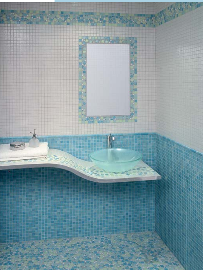
Fot. 2. Emaux de Briare – Kolekcja Marienbad