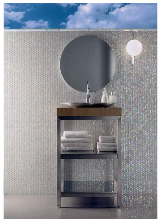
Fot. 7. Mozaika Barrels Flax z kolekcji Neoglass

tak jak malarstwo, odejścia czyli przestrzeni, by można je było kontemplować w całości. Nie jest prawdą, że dekor – szlaczek z mozaiki, zwykle zestawiony z dużymi płytkami gresu, wystarczy. Takie rozwiązanie przebrzmiało już kilka lat temu i z obecną modą nie ma nic wspólnego.