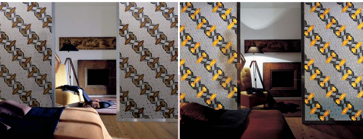
Fot. 5. Mozaika Gray 08 z kolekcji Glass 3 na przejrzystym podłożu. Efekt OFF/ON – podświetlona od drugiej strony i nie podświetlona

ne, eleganckie czarno-zielone, brązy, szarości. Piękną gamę tworzą mozaiki „petrol” w kolorach ziemi, popiołu, dymu, jesiennych liści, ciemnych pereł z odcieniami opalizującymi. Jest to nawiązanie do modnego stylu fusion i do klimatów etnicznych. Mozaiki z kolekcji Glass 3 można umieścić na przejrzystym podłożu: szkłe lub pleksi i podświetlić od drugiej strony (fotografia 5). Mozaika wygląda zupełnie inaczej przy zgaszonym i zapalonym świetle. Szklane kostki w różnym stopniu przepuszczają światło, a więc nie tylko kolory, ale i rysunek się zmienia. To jakby dwie mozaiki w jednej. Mozaiki sprzedawane są w arkuszach o wymiarach 29,6 x 29,6 x 0,4 cm. Arkusze są ponumerowane wg załączonego schematu.