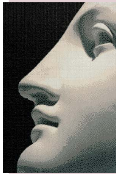
Fot. 2. Obraz z mozaiki Parys, postać z mitologii greckiej

Dotychczas panele Bisazzy były sprzedawane tylko w formie gotowych do powieszenia obrazów, o określonych wymiarach i umieszczonych na drewnianym podłożu. Tegoroczną nowością są panele do samodzielnego naklejenia. Dodatkowo można