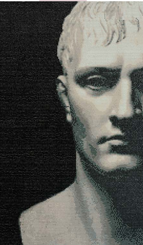
Fot. 1. Mozaika Bonaparte, interpretacja neoklasycznej rzeźby Antonio Canovy zaprojektowana z użyciem techniki komputerowej

Szklane mozaiki są bardzo modne, a producenci prześcigają się w wymyślaniu nowych kolekcji, coraz efektowniejszych, bajecznie pięknych i bajecznie drogich.