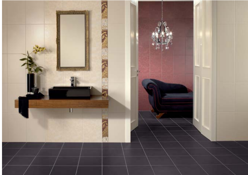
Kolekcja New Glory

AvB: Podstawowym argumentem przemawiającym za stosowaniem pły-