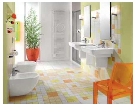
Kolekcja Pro Architectura New

„Houses of Villeroy & Boch” powstały w 125 krajach na świecie. W Polsce jest ich pięć (w Łodzi, Krakowie, Warszawie, Rykach oraz w Białymstoku).