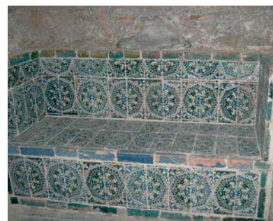
Doskonale zachowane płytki ceramiczne w twierdzy Alhambra w Granadzie

W 2006 r. Hiszpanie wyeksportowały 335,72 mln m 2 płytek za kwotę 2183,09 mln EUR, przy średniej cenie metra kwadratowego 6,50 EUR. W porównaniu do 2005 r. wielkość eksportu