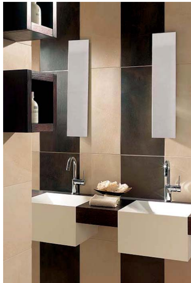
Kolekcja Tibet, Pamesa Ceramica

Warto też kilka słów poświęcić polskiemu rynkowi, który w hiszpańskich statystykach eksportu od 1990 r. przed-