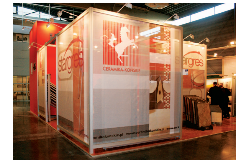
Fot. 3. Stoisko Ceramiki Końskie

Bardzo ciekawe i z pewnością interesujące dla producentów płytek ceramicznych były elementy dekoracyjne, debiutującej na targach Budma, firmy IDEN . Wytwarzane z kompozytu mineralno-polimerowego oraz uzupełniane