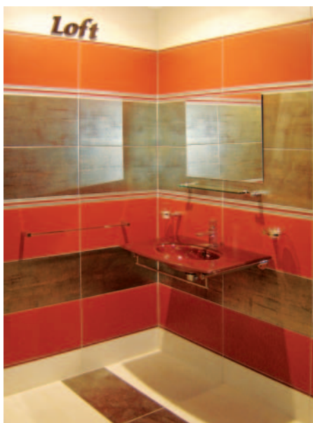
Fot. 1. Kolekcja Loft, Ceramika Marconi

ofertę na targach BUDMA 2007 byli: Polcolorit S.A., Ceramika Marconi, Ceramika Iza, Ceramika Końskie, Ceramika Nowa Gala, Star Gres, ZPC Przysucha Klinkier . Kolekcje prezentowane przez te firmy potwierdzają wysoki poziom techniczny i artystyczny płytek produkowanych przez polskie zakłady. Zainteresowanie pokazowanymi nowościami było bardzo duże!