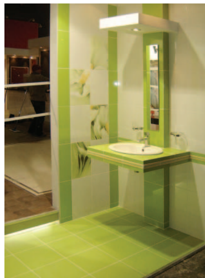
Fot. 2. Kolekcja Styl, Polcolorit S.A.

Corrida to śmiałe połączenie pastelowych płytek w beżowej tonacji z brązo-