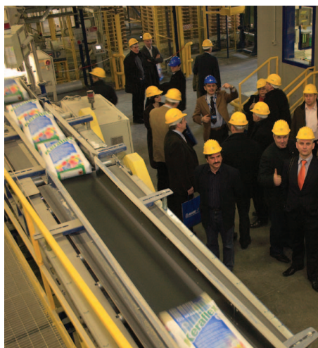
Fabryka w Mediglii (k. Mediolanu) o rocznej zdolności produkcyjnej ok. 600 tys. t to jeden z 45 zakładów produkcyjnych MAPEI na świecie

Minimalny czas oczekiwania na towar i perfekcyjna obsługa klienta, przy obecnej sytuacji na rynku, staje się głównym elementem konkurencyjności wśród dystrybutorów.