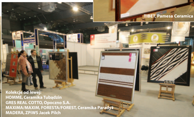
Kolekcje od lewej: HOMME, Ceramika Tubądzin GRES REAL COTTO, Opoczno S.A. MAXIMA/MAXIM, FORESTA/FOREST, Ceramika Paradyż MADERA, ZPiWS Jacek Pilch