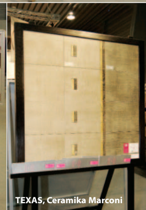
TEXAS, Ceramika Marconi