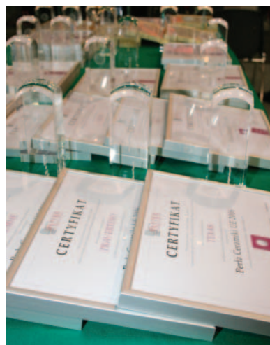
Statuetki i certyfikaty – nagrody przyznane w konkursie Perły Ceramiki UE 2006

Redakcja kwartalnika „Wokół Płytek Ceramicznych” organizuje konkurs Perły Ceramiki UE corocznie od 2004 r. Jego celem jest promowanie kolekcji płytek ceramicznych znajdujących się na polskim rynku, wyróżniających się nie tylko parametrami technicznymi, a także ciekawym wzornictwem, zgodnym z najnowszymi światowymi trendami. Konkurs jest dwuetapowy. Pierwszy etap składa się z trzech równorzędnych edycji, w których niezależne, opiniotwórcze jury związane zawodowo z wzornictwem przemysłowym, architekturą i wyposażeniem wnętrz nominuje kolekcje płytek do tytułu Perła Ceramiki UE.