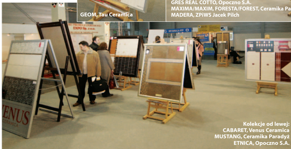
Kolekcje od lewej: CABARET, Venus Ceramica MUSTANG, Ceramika Paradyż ETNICA, Opoczno S.A.