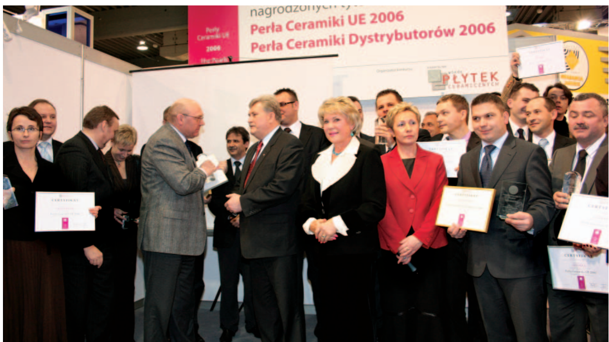
Laureaci konkursu Perły Ceramiki UE 2006. Gratulujemy, życzymy kolejnych sukcesów – redakcja kwartalnika „Wokół Płytek Ceramicznych”

Gratuluję pomysłu konkursu i jego skutecznej realizacji.