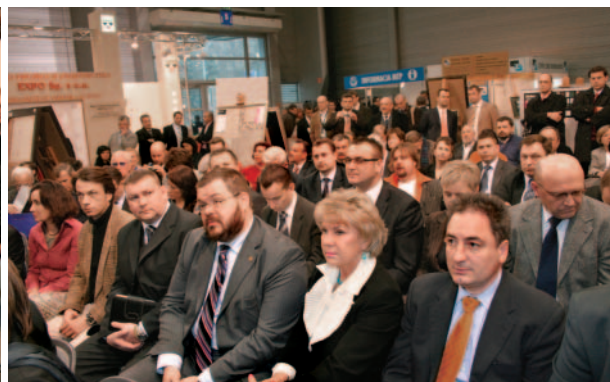
Na Galę Laureatów licznie przybyli przedstawiciele producentów płytek ceramicznych, dystrybutorzy, importerzy oraz architekci