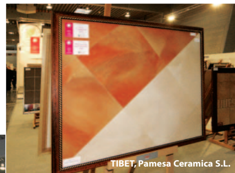
TIBET, Pamesa Ceramica S.L.

Uroczystości wręczenia Perł Ceramiki UE 2006 i Perł Ceramiki Dystrybutorów 2006 w konkursie Perły Ceramiki UE 2006 towarzyszyła wystawa nagrodzonych kolekcji płytek ceramicznych. Kolekcje zaprezentowane w postaci obrazów mogli obejrzeć zwiedzający Międzynarodowe Targi Budownictwa BUDMA 2007.