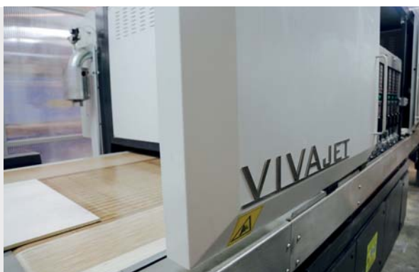
Cyfrowa drukarka firmy TecnoFerrari

dzenia – zapewniają przedstawiciele firmy. Na powierzchni 160 m 2 zaprezentowane zostaną premierowe kolekcje oraz pozostała oferta Star-Gresu. Firma zapowiada także kolejne innowacyjne rozwiązania. Na stoisku będzie można podziwiać nowy format w grupie kolekcji STAR 2.0, czyli płytkę 75 x 75 cm oraz płytkę grubości 3 cm , które firma wprowadzi do produkcji jako drugi producent na świecie. Oprócz obejrzenia nowości, zachęcamy, aby porozmawiać z przedstawicielami firmy, na tematy produkcji, oferty oraz zapoznać się z materiałami promocyjnymi. Star-Gres cały czas się rozwija. Jego produkty cieszą się zaufaniem klientów nie tylko w Polsce, ale i na świecie. Udział sprzedaży eksportowej firmy to 50% produkcji i jest największy spośród wszystkich producentów płytek ceramicznych w Polsce.