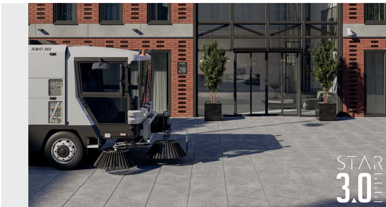
Otoczenie budynku wyłożone płytkami STAR 3.0