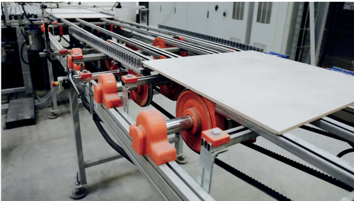
Fragment linii produkcyjnej

W tym roku firma zapowiada premierę swojego kolejnego innowacyjnego na polskim rynku produktu STAR 3.0 , czyli płytki o grubości 3 cm. Produkty Star-Gresu można zobaczyć na wszystkich ważnych, międzynarodowych targach branżowych. Firmowe stoisko jest chętnie odwiedzane przez gości i kontrahentów, a prezentowane płytki zbierają pochlebne opinie. Firma zaprasza na najbliższe targi Cersaie 2018 odbywające się, jak co roku, pod koniec września w Bolonii. Nowe, powiększone, w porównaniu z zeszłorocznymi targami, stoisko będzie godne odwie-