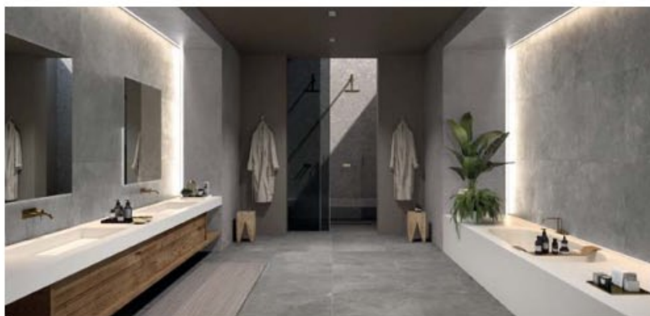
Kolekcja ALPES WIDE

Płytki firmy ABK stworzone w ramach programu WIDE perfekcyjnie odpowiadają na potrzeby współczesnego wzornictwa i architektury. ALPES